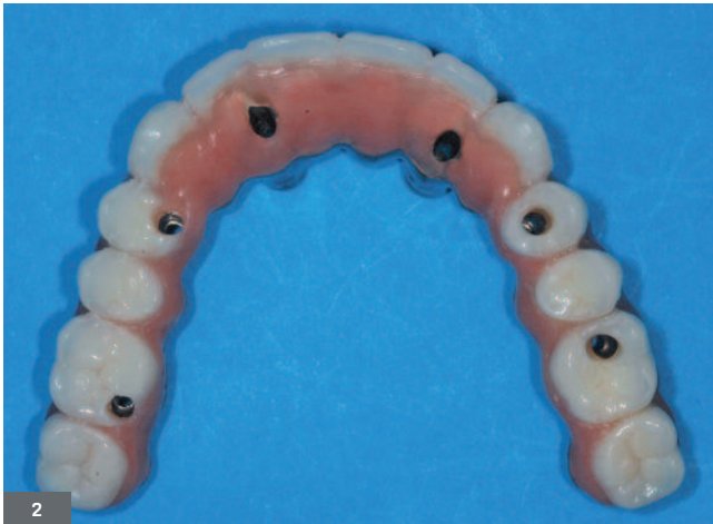
Fig. 2. Suprastructure transvissée avec armature usinée par CFAO.

Fig. 2. Screwed suprastructure with CAD-CAM manufactured framework.