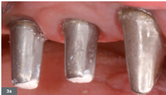
Fig. 3a. Infrastructures transvissées.

Fig. 2. Screwed suprastructure with CAD-CAM manufactured framework.