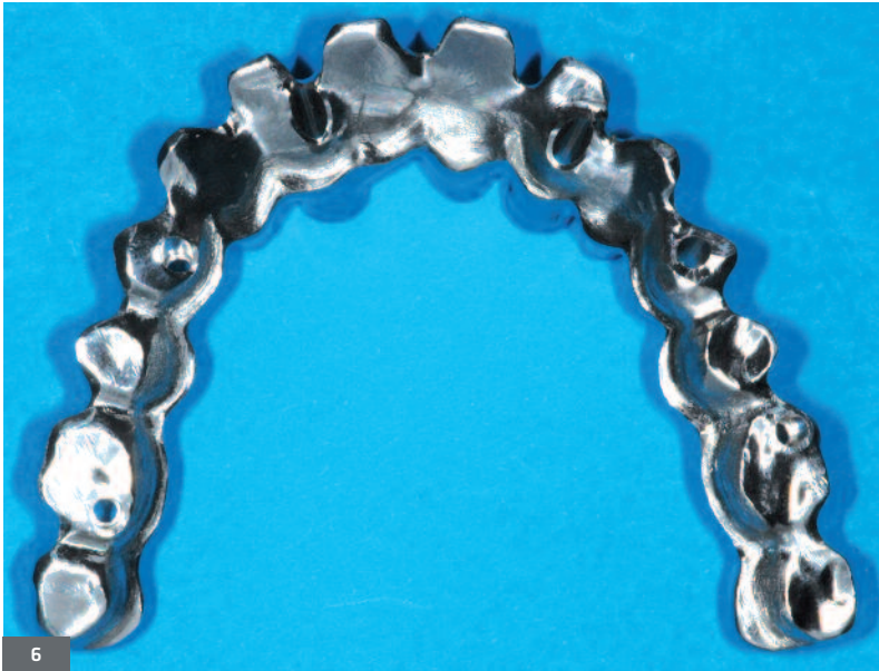
Fig. 6. Armature transvissée fraisée par CFAO.

Fig. 6. Screwed framework milled with CAD-CAM.