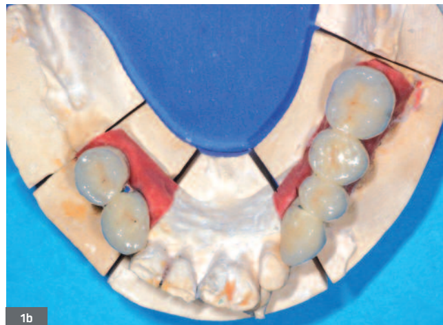
Fig. 1b. Suprastructure scellée sur une infrastructure transvissée. Fig. 1b. Suprastructure sealed on a screwed infrastructure.