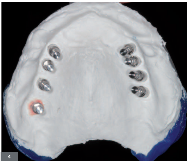
Fig. 4. Empreinte au plâtre. (avec l'aimable autorisation du Pr O. Fromentin, laboratoire Edentech).

At the clinical stage, impressions and working model are one of the main sources of errors (Karl M. et al., 2005; Stephan G. et al., 2004; Drago C. et al., 2012). Whatever the impression technique, there is no significant difference as far as accuracy is concerned (Heckmann S.M. et al., 2004). It is thus necessary to choose the impression technique that suits best the clinical context and to observe carefully the impression protocols (Swallow S.T., 2004) (fig. 4 and 5).