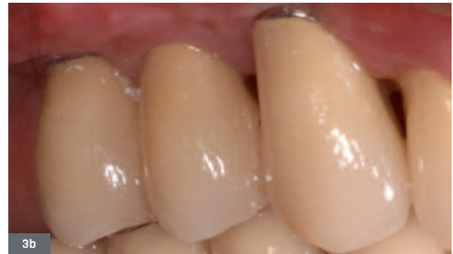
Fig. 3b. Suprastructure scellée sur plusieurs infrastructures transvissées.

Fig. 3b. Suprastructure sealed on several screwed infrastructures.