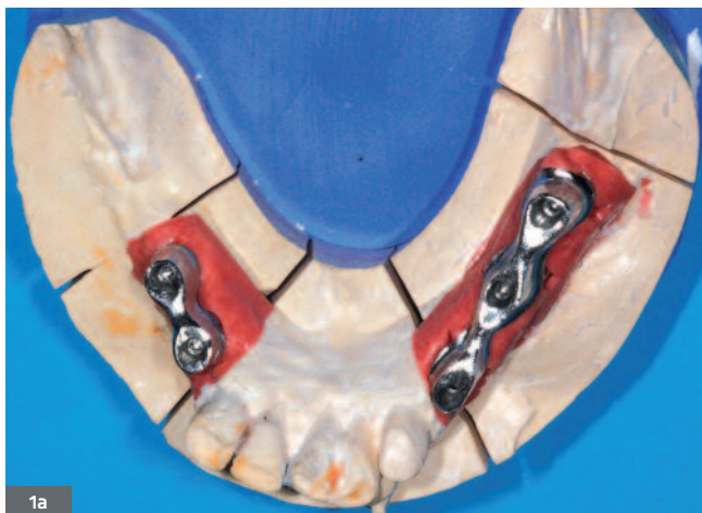
Fig. 1a. Infrastructure transvissée. Fig. 1a. Screwed infrastructure.